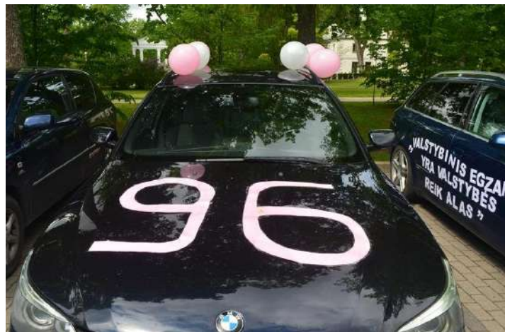
Tęsinys 2 puslapyje

Nuotaikų „mixas“ šiuo metu 😊 Liūdna, nes tenka palikti savo draugus, artimą aplinką, tačiau tuo pačiu metu smagu pradėti gyventi savarankiškai. Tikiuosi, kad ateityje sugebėsiu greitai prisitaikyti, mokėsiu suderinti mokymosi universitete laiką su darbu, laisvalaikiu. Šis laikotarpis svarbus, nes susipažinau su labai daug žmonių, teko vyksti į jaunimo mainus.