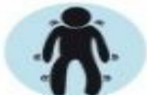
Silpnumas ir nuovargis