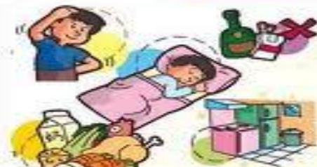
Sveikas gyvenimo būdas ir aplinka