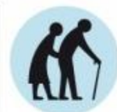
Senyvo amžiaus asmenys