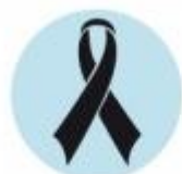
Asmenys infekuoti ŽIV