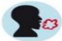
Atsikosėjimas skrepliais ir krauju